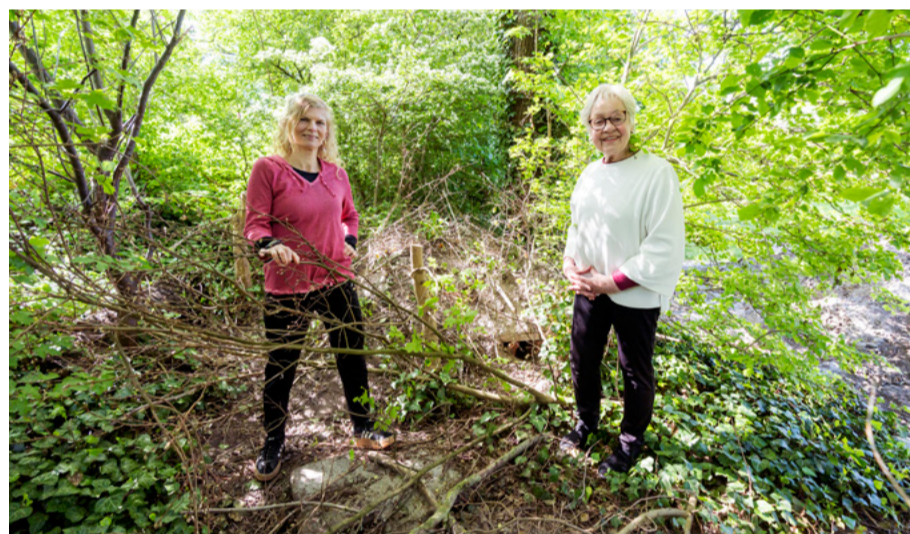
Een deel van de egelwerkgroep voor de burcht