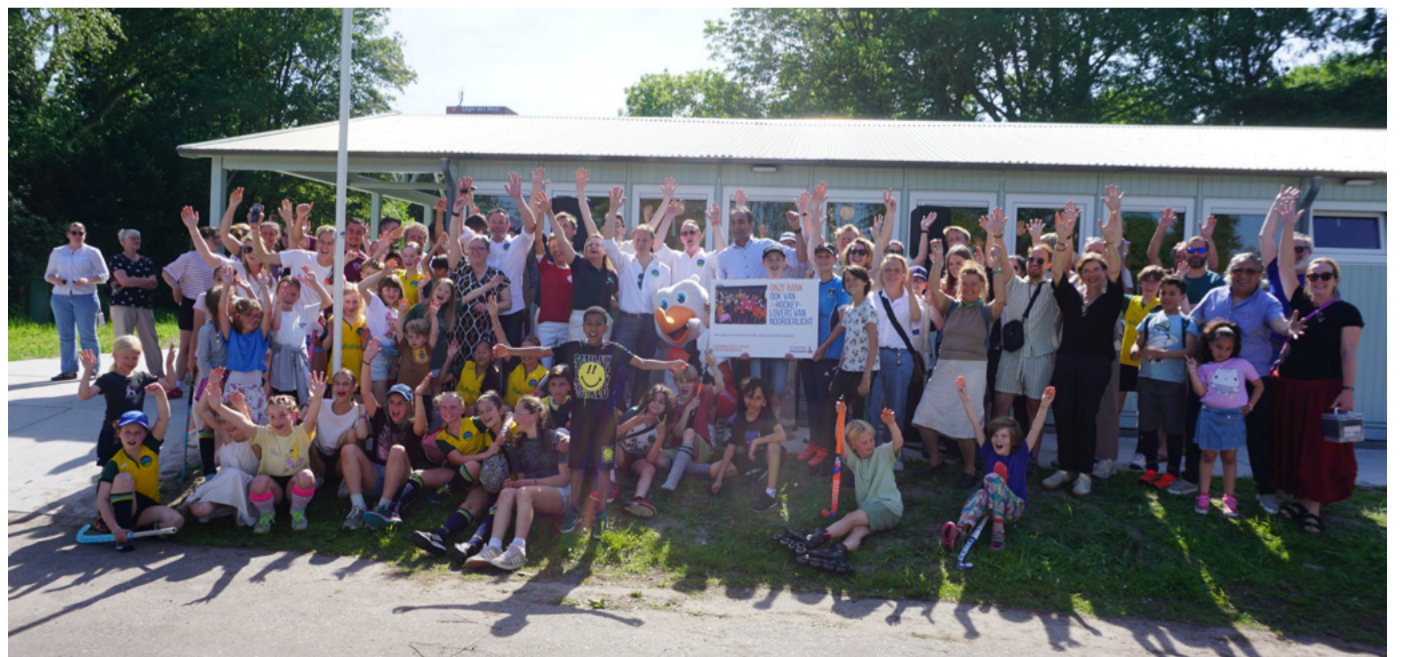
De leden zijn erg blij met het nieuwe clubhuis

Het nieuwe clubhuis biedt ook ruimte voor ontmoeting: het heeft een tweede rol als buurthuis. Bewoners of organisaties