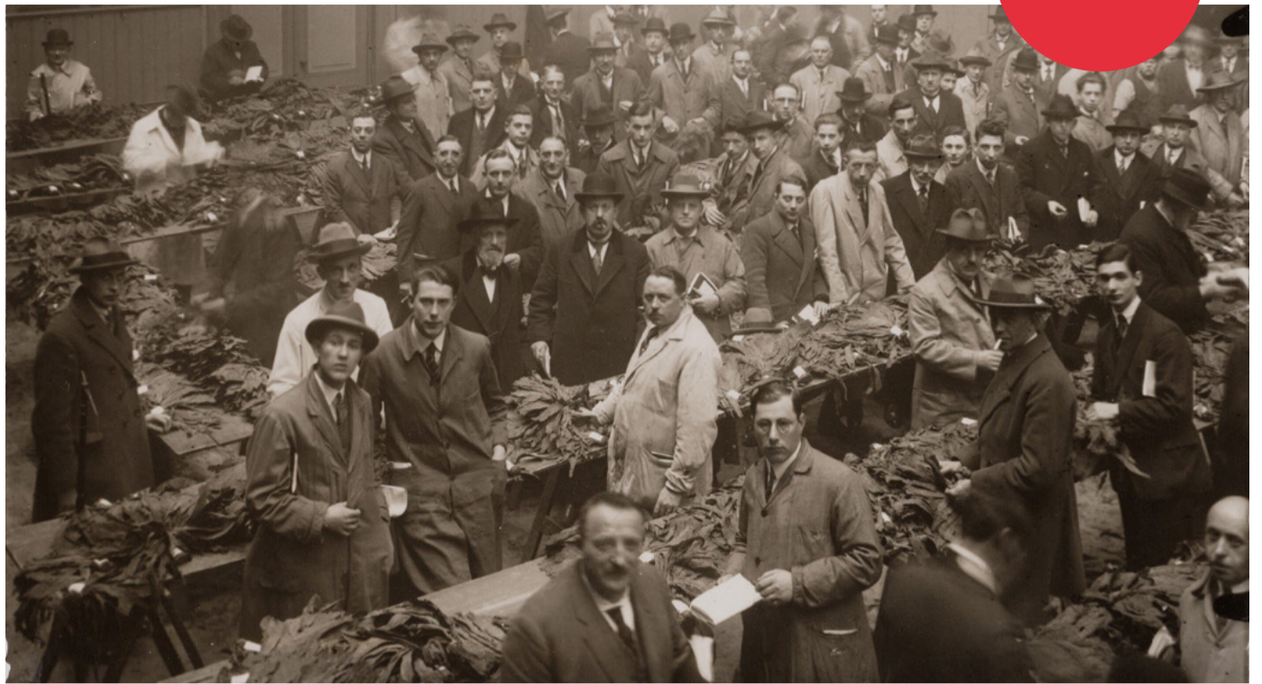
Het keuren van koloniale tabak in de Nes | Foto Stadsarchief Amsterdam

Ook andere grote gebouwen en buurten in Amsterdam toonden de koloniale wereld. Zoals De Bazel aan de Vijzelstraat, dat nu het Stadsarchief huisvest. In 1926 werd het geopend als het nieuwe hoofd-