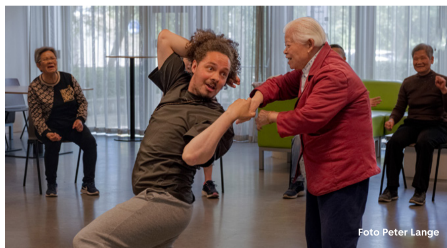
Vrijwilliger (links) geeft dansles voor 50-plussers om fit te blijven

Voor wie zich niet wil vastleggen zijn er ook losse klussen, zoals helpen bij evenementen of activiteiten. Vrijwilligerswerk hoeft dus niet groot te zijn. Kleine dingen zoals een gesprek of een kookmoment kunnen al veel betekenen. Kijk voor meer informatie op amsterdam.nl/vrijwilligerswerk en vca.nu of bel 020 530 12 20.