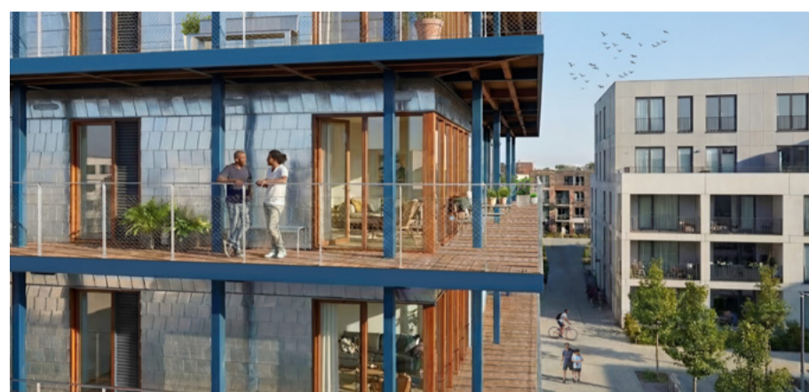
Impressie van de achtergevel

Aansluiten bij de Bonte Hulst betekent tijd investeren als lid van 1 of meer commissies. Debeye: “Ik ben zo’n 5 à 10 uur per week bezig voor de Bonte Hulst. Ik zit in de mediacommissie en richt me ook op ledenwerving en informatie-avonden. Ook help ik mee met de organisatie van gezellige evenementen, zoals de zomerborrel. Hier nodigen we ook de buurt voor uit.” De gepensioneerde